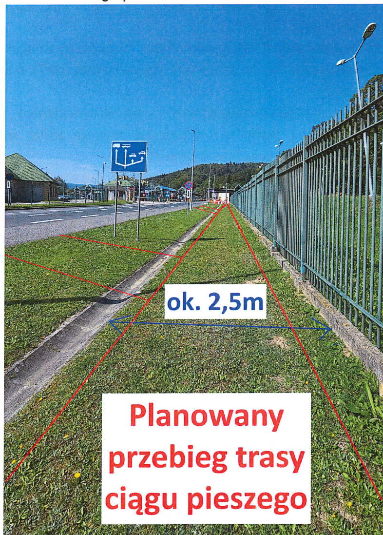
Planowany przebieg trasy z widoczną infrastrukturą