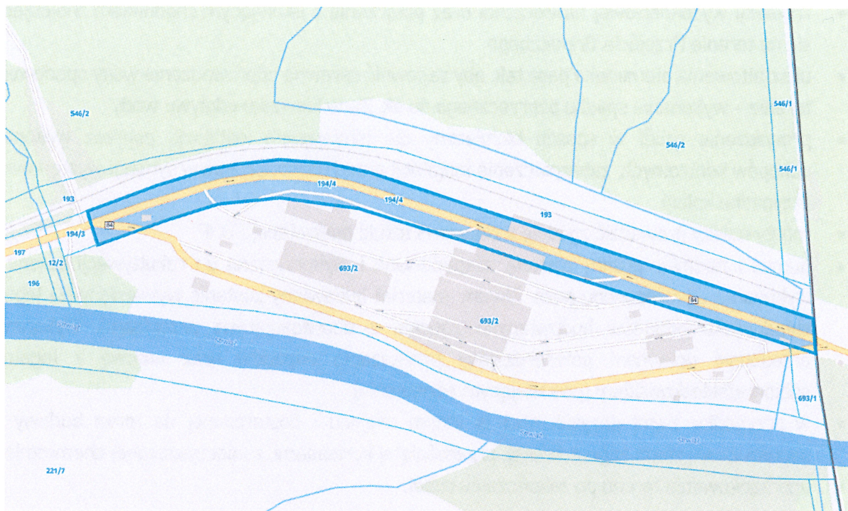
Działka nr 194/4, obr. 0014 Ustrzyki Dolne