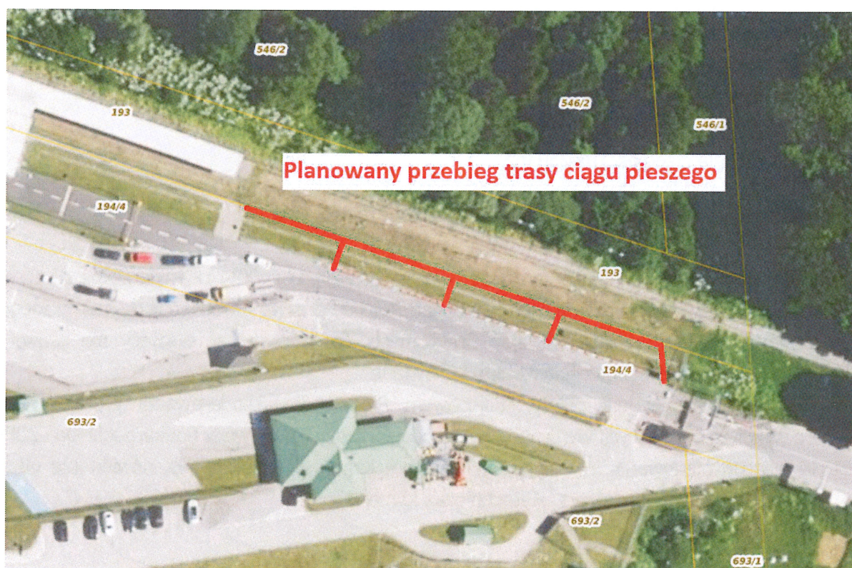
Planowany schematyczny przebieg trasy utwardzonego ciągu pieszego